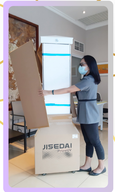
3. Buka penutup bagian atas