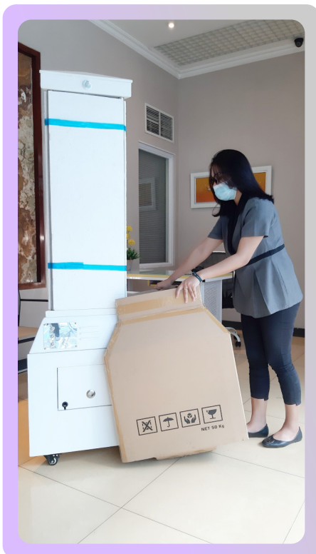
4. Buka penutup bagian bawah