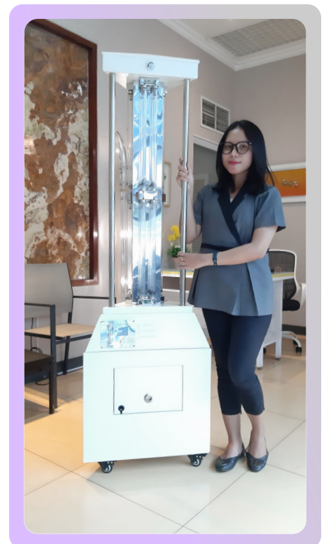
6. Jisedal Prizmuv Tower siap digunakan