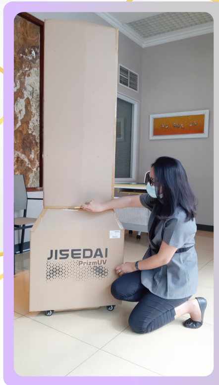
2. Buka selotip penutup bagian sambungan & bawah