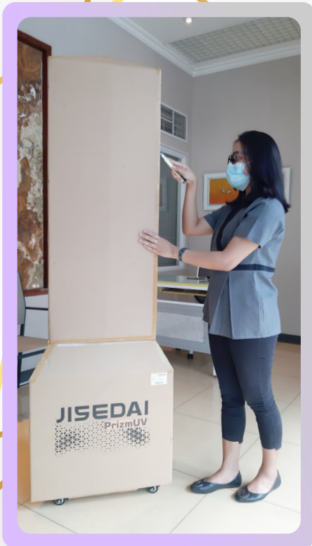
1. Buka selotip penutup bagian atas